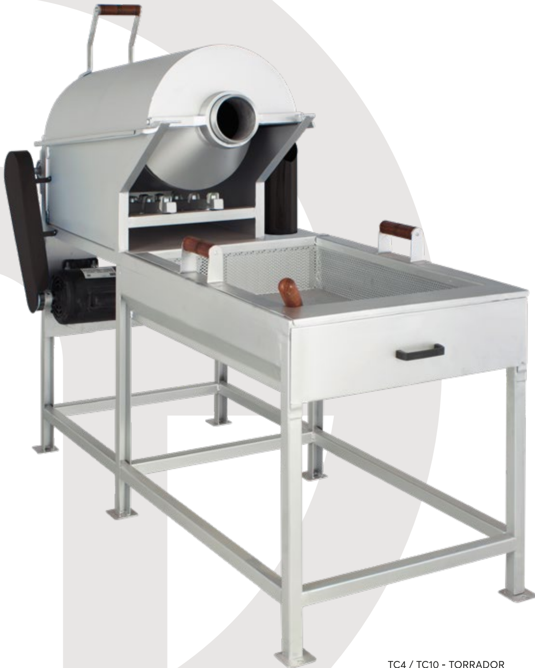
TC4 / TC10 - TORRADOR TRADICIONAL

IDEAL PARA TORRAS RÁPIDAS E VÁRIAS TORRAS DURANTE O DIA