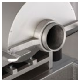
Boca do torrador