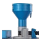
Moega de entrada