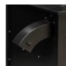
Saída da palha