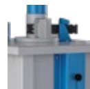
Régua de classificação