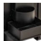
Moega de saída de café descascado