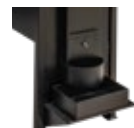
Saída de café descascado