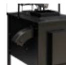
Saída de palha