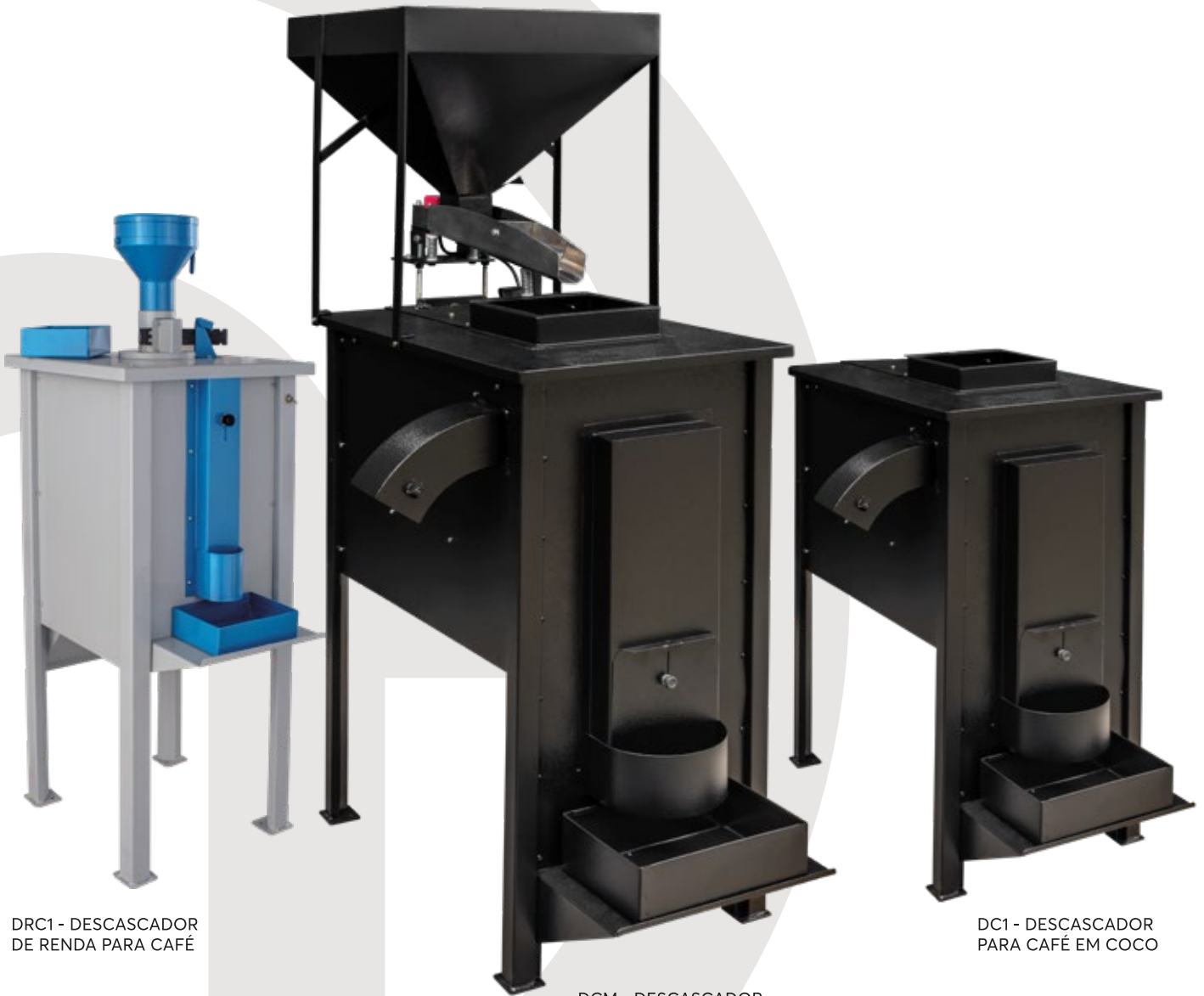
DRC1 - DESCASCADOR DE RENDA PARA CAFÉ

OS DESCASCADORES DE CAFÉ EM COCO E DE RENDA DA CARMOMAQ SÃO FAMOSOS POR SUA VERSATILIDADE, FÁCIL INSTALAÇÃO E OPERAÇÃO, ALÉM DE EFICIÊNCIA NA SUCÇÃO DAS PALHAS