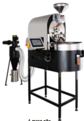
A mesa não faz parte do torrador

Este torrador possui um sistema integrado que possibilita alternar durante a torra, a condução e a convecção térmica. Disponível na versão de 500 g a 2 kg por torra.