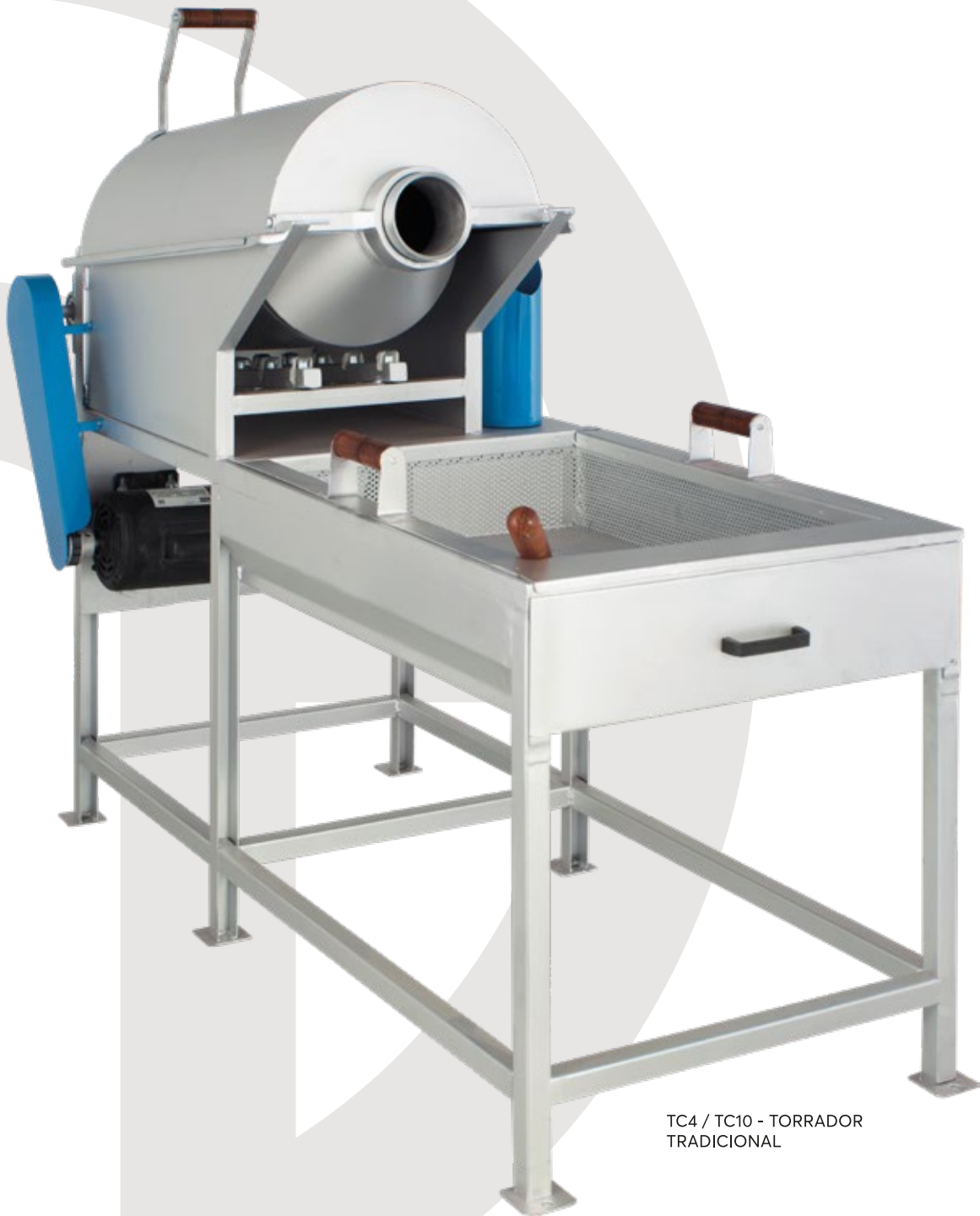
TC4 / TC10 - TORRADOR TRADICIONAL

IDEAL PARA TORRAS RÁPIDAS E VÁRIAS TORRAS DURANTE O DIA