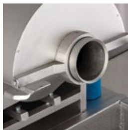
Boca do torrador