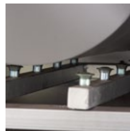
Sistema de queimador do torrador